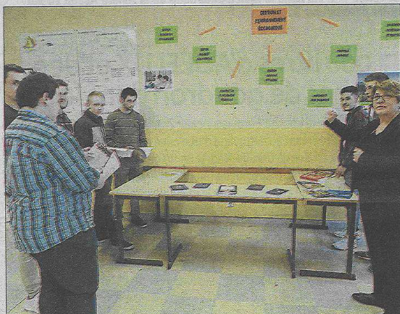
À l'institut François Marty, on se renseigne sur les filières.