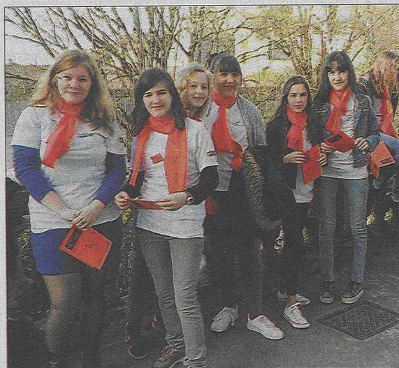
Au lycée Saint-Joseph, il fallait suivre les jeunes guides...